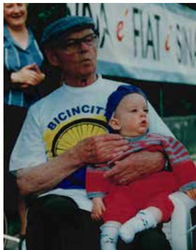
1994 una delle prime iniziative di raccolta fondi "Bicincitta".

1992 la Sezione viene dotata di un automezzo idoneo al trasporto di persone in carrozzina, omaggio di una azienda locale. Tale mezzo ci consente di raggiungere anche le persone con SM più distante. Nello stesso anno, la sezione acquista un computer che permette di velocizzare il lavoro e avere un contatto diretto con la Sede Nazionale.