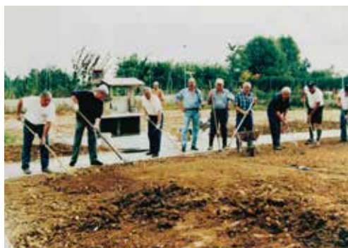
2000 alcuni volontari all'opera per preparare il giardino della nuova sede

in condizione di necessità. La Sezione di Pordenone realizza il primo Bilancio sociale di Sezione che verrà presentato nel 2008, unitamente al Bilancio Sociale Nazionale, nel corso del Congresso Nazionale Soci. 2010 parte il progetto Info-point c/o Centro Clinico SM nel reparto Neurologia dell'Ospedale "Santa Maria degli Angeli" di Pordenone